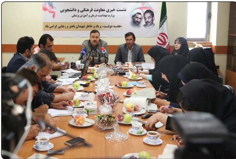
نشست خبری معاونت فرهنگی و دانشجویی وزارت بهداشت، درمان و آموزش پزشکی «هفته دولت» و یاد و خاطر شهدان باهر و رجایی گرامی باد

جوانان امروز ما بسیار فهیم اند و موضوعات را اقلای می پذیرند